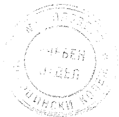
ГРАФИК за извънредна поправителна изпитна сесия на специалност “Инспектор по общественото здраве” За III курс на учебната 2018/2019 година През м. февруари 2019 година