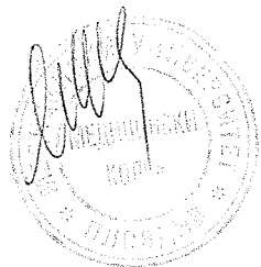
ГРАФИК за редовна изпитна сесия на специалност "Медицинска козметика" Зимен семестър учебна 2017 / 2018 година от 05.01. до 02.02.2018 година